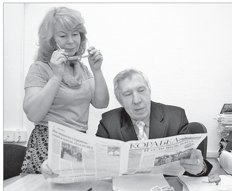
Что там в «Корабеле»? Что там на Севмаше?

С тех пор, как профессиональный праздник журналистов с майской страницы календаря переместился на январскую, тринадцатый день года всякий раз застаёт газетчиков врасплох. К рабочим станкам, в том числе и печатным, люди возвращаются после продолжительных зимних каникул, и не сразу привыкают к устоявшемуся ритму жизни.