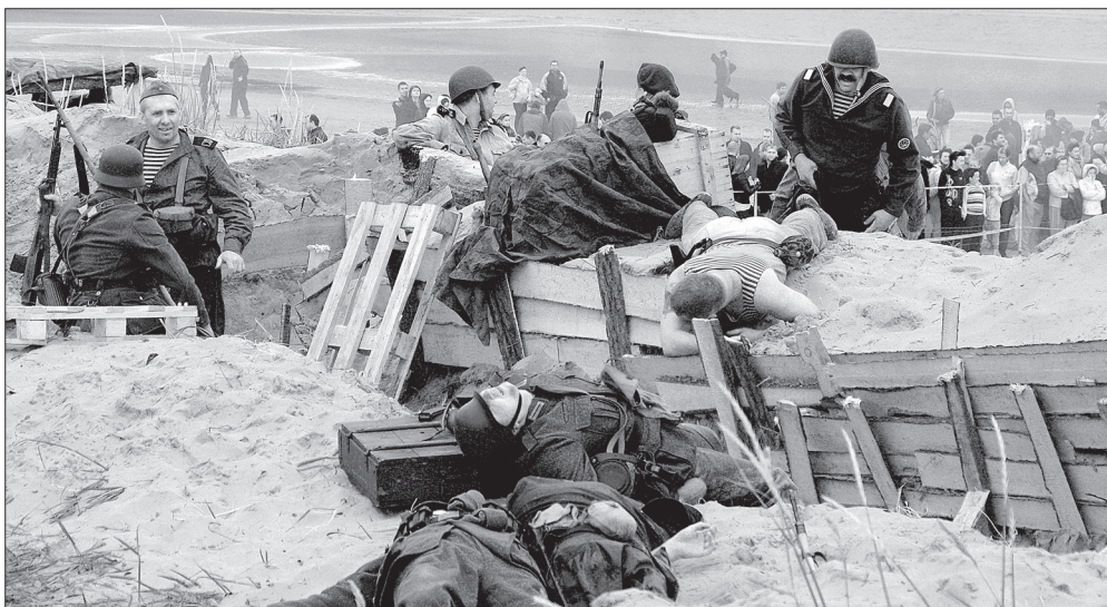
При штурме «фашистских» укреплений наши победили

«Штурм» береговых укреплений «гитлеровцев» происходил в ситуации максимально (насколько это возможно при сотнях зрителей) приближённой к боевой. Под оглушительные взрывы «снарядов», стрельбы холостыми патронами из автоматического оружия, в том числе и крупнокалиберных пулемётов наши, преодолевая дымовую завесу, атаковали врага с моря. Раскатистое «ура» слышалось не только от участников «боевой операции», но и от зрителей, впечатлённых успешно созданным эффектом присутствия. «Бей фрица! Вперёд, давай!!!», – кри-