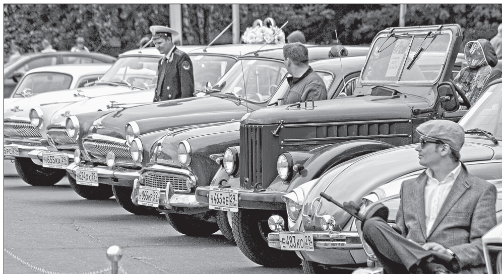
Ретроавтомобили до сих пор в строю