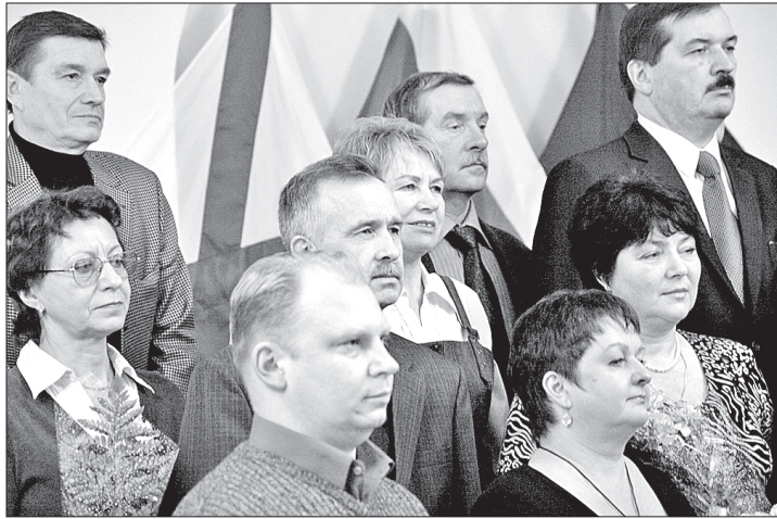
Их отметило министерство