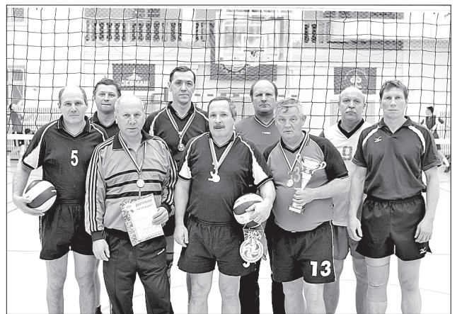
Победители соревнований – сборная ветеранов Севмаша

– Цех выполнит свои производственные задачи?